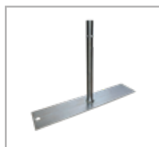
PIEDE TIPO ROMA su ordinazione