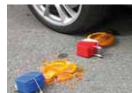
LA CONCORRENZA SI ROMPE