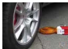
LA LAMPADA RESTA INTEGRA