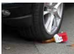
PROVA PASSAGGIO AUTO

DOPPIO INTERRUETTORE per il funzionamento a luce lampeggiante o a luce fissa, con foto-sensore crepuscolare per il funzionamento notturno, fornita completa di staffa universale posteriore per l'installazione.