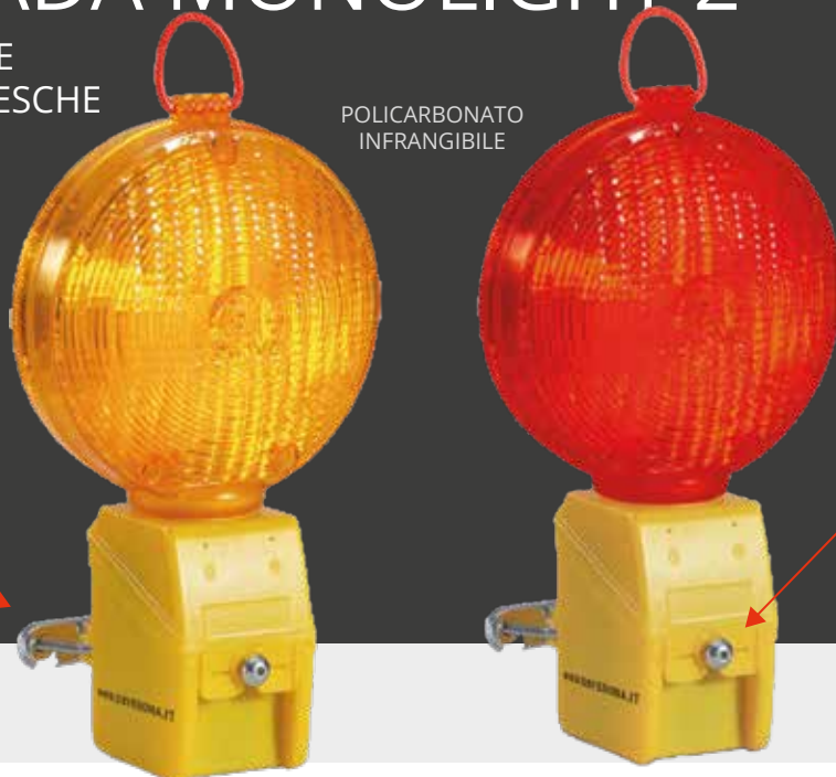
Figura 905 - Cod.3065000050