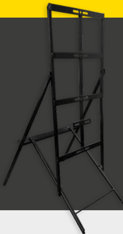
Figura 611 - Cod. 3160020601