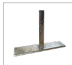
PIEDE TIPO ROMA su ordinazione